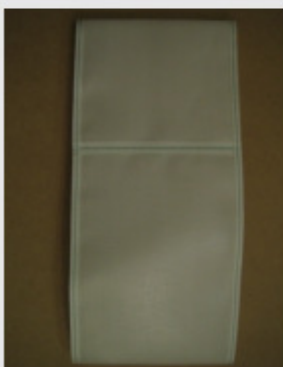
Toiles, sacs et poches d'essoreuses